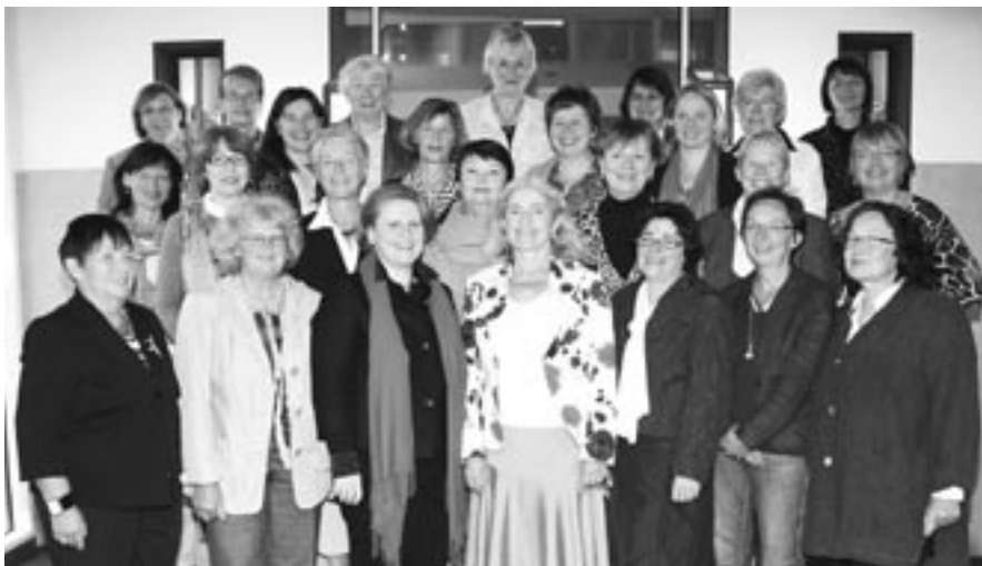
Konferenz der Landesfrauenräte (KLFR) in Saarbrücken

*** Delegiertenversammlung in Braunschweig *** Tag der Niedersachsen in Celle *** *** Veranstaltung „Gleichberechtigung erreicht?“ *** Konferenz der Landesfrauenräte in Saarbrücken ***