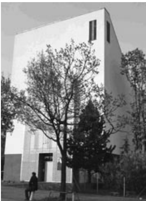
Die Dankeschön-Veranstaltung 2010 findet statt in der Liberalen Jüdischen Gemeinde Hannover.

Liberale Jüdische Gemeinde Hannover e.V. Etz Chaim, Fuhsestraße 6, 30419 Hannover, www.ljgh.de