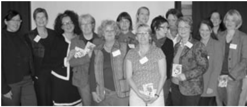
Delegiertenversammlung in Braunschweig