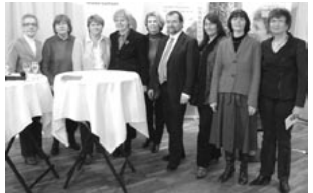
Veranstaltung „Gleichberechtigung erreicht?“