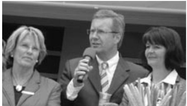
Tag der Niedersachsen in Celle