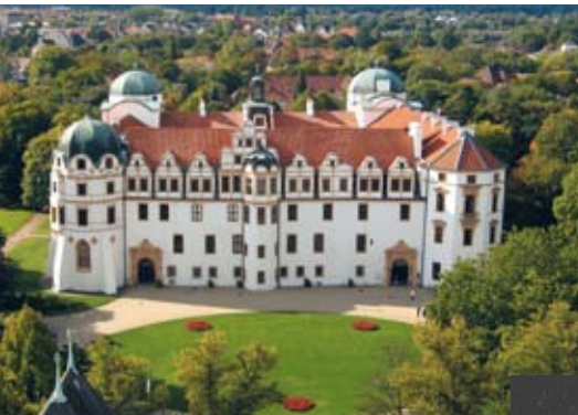
Das Celler Schloss