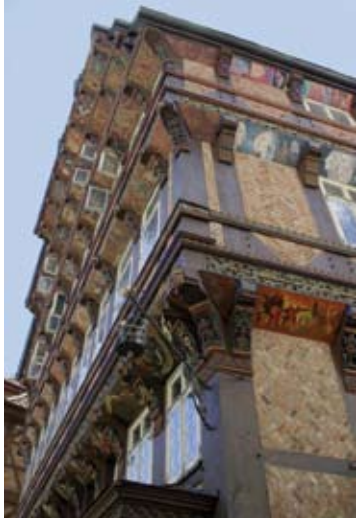
Knochenhauer-Amtshaus in Hildesheim