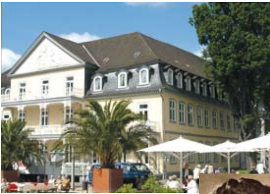
Der „Fürstenhof“ in Bad Pyrmont