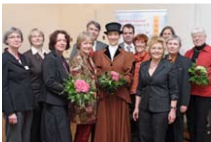
Der erste frauenORT Niedersachsen gilt 2008 Anita Augspurg in Verden

Die Initiative frauenORTE Niedersachsen des Landesfrauenrates entfaltet sich in den Städten und Regionen des Landes durch den Ideenreichtum und das große Engagement der Kooperationspartnerinnen und -partner vor Ort. Gerne beantworten sie Ihre Anfragen.