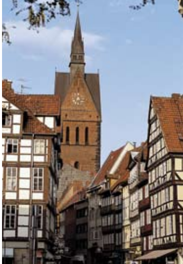
Die Marktkirche in Hannovers Altstadt