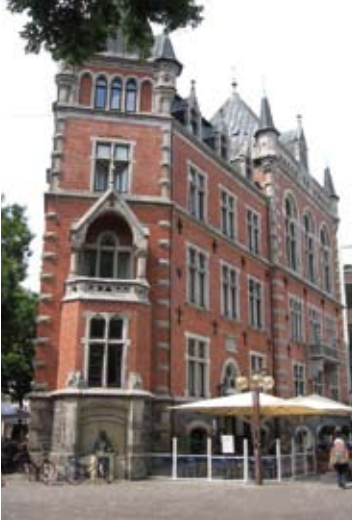
Das Rathaus in Oldenburg