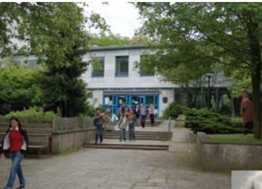
Ricarda-Huch-Schule in Braunschweig