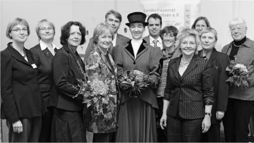
Auftaktveranstaltung 2008 in Verden